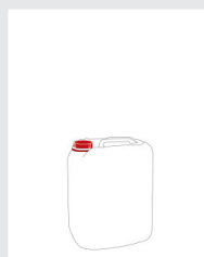
Kanister 5 l Art.-Nr.: 2003631