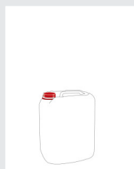
Kanister 5 l Art.-Nr.: 2003632